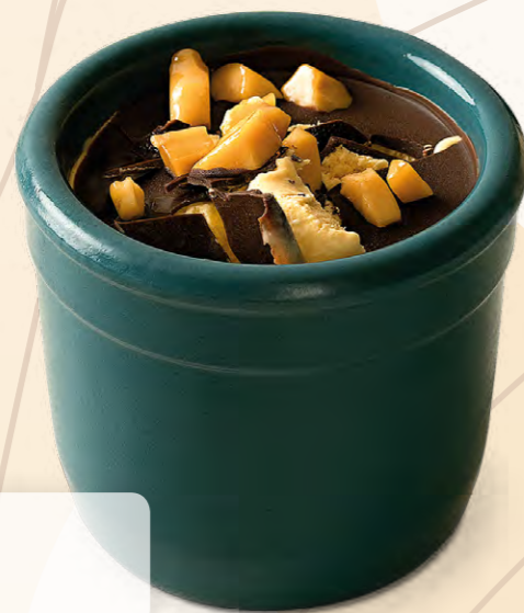
Slaný karamel (140 ml)