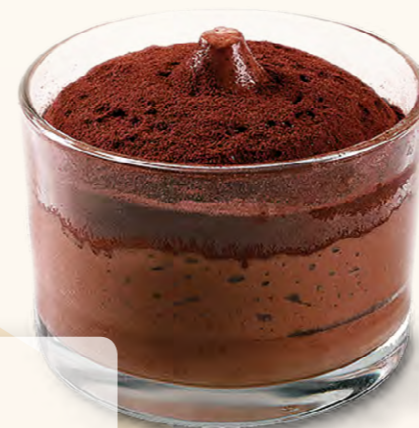
Tartufo (90 g)