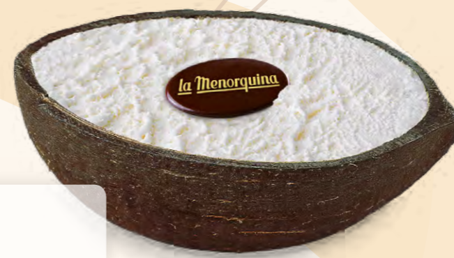
Coco (150 ml)