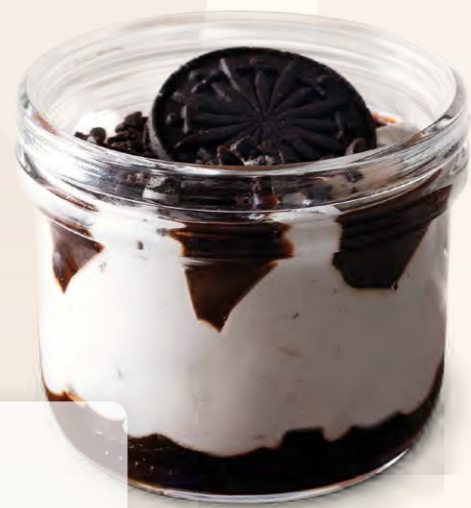
Pohár Cookies (180 ml)