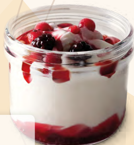
Pohár lesní ovoce (150 ml)