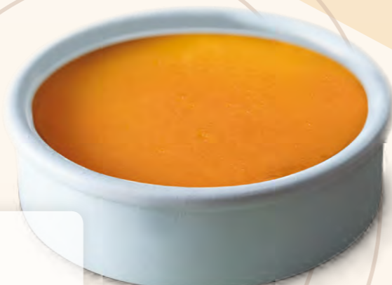
Creme Brulée (150 ml)