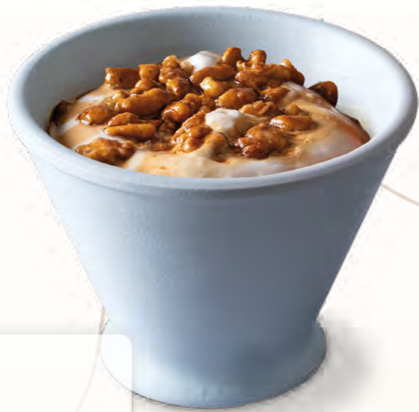
Nata Nueces (170 ml)