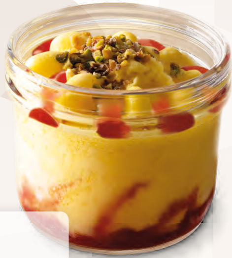
Pohár Mango (150 ml)