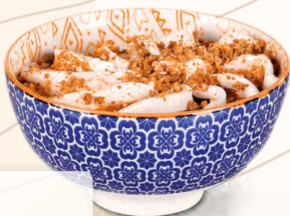
Panna cotta (95 g)