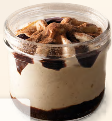
Pohár Tiramisu (150 ml)