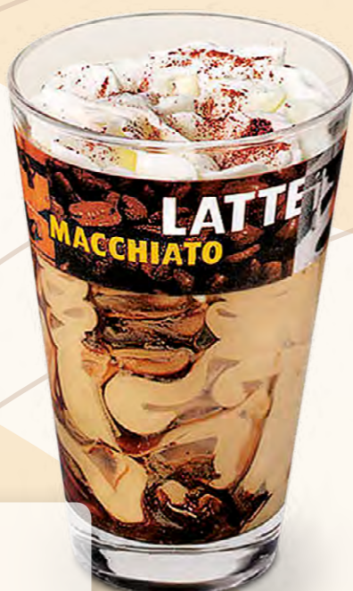
Latte Macchiato (180 ml)